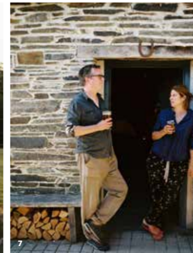
6. Soirée barbecue sur une colline surplombant la baie de Cardigan. 7. Couple en mode « off the grid » à l'entrée du pub de Fforest.

17 heures, lorsque j'ai terminé ma journée reste un de mes grands plaisirs l'été. » Sa petite entreprise siège dans les étables rénovées d'une ferme du XVIII e siècle. A l'entrée des lieux, des bouquets de lavande séchent sur un fil, tandis que des sels de bain sont prêts à partir pour le Ace Hotel de Shoreditch. Les hipsters londoniens et célébrités raffolent de ces crèmes de beauté, au logo invitant à un retour à la terre (le dessin d'un tracteur) et à la composition épurée et respectueuse de l'environnement. On retrouve cette même éthique et cette rigueur chez Pablo Spaul, DJ et chocolatier, dont la minichocolaterie, Forever Cacao, se niche au bout d'un chemin de terre, au milieu des champs. « Je ne travaille qu'avec les petits producteurs de cacao des coopératives ashaninka au Pérou et j'utilise du sucre de coco biologique d'Indonésie », raconte ce passionné dont la fabrication se compte en un millier de tablettes de chocolat en moyenne, par semaine, dans sept variétés différentes.