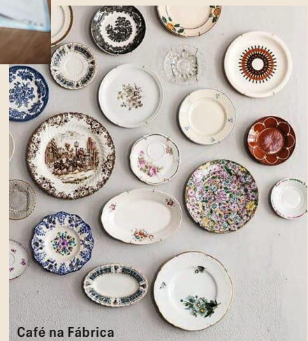
Café na Fábrica