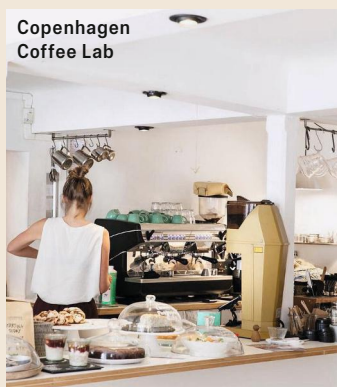
Copenhagen Coffee Lab