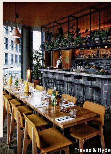
Treves & Hyde