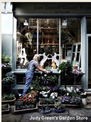
Judy Green's Garden Store